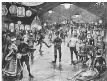
Masopustní bruslení na Primátorském ostrově (kresby Karla Štapfera – Zlatá Praha 1888)