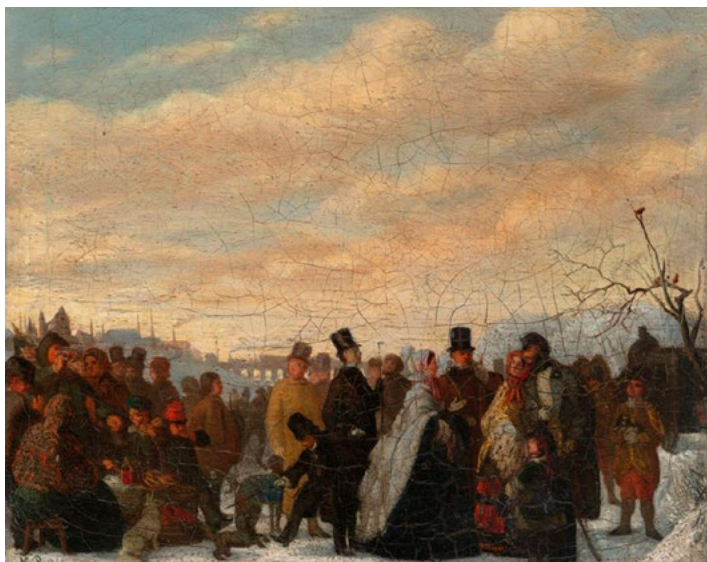
obraz – Karel Purkyně (1858)

a dědečka prezidenta Václava Havla. V této souvislosti je zajímavá méně známá skutečnost, že podle původního záměru z roku 1912 měla být Lucerna zimním palácem s podzemní ledovou plochou.